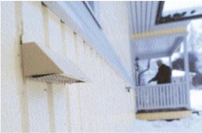
Det är inte mycket som syns av systemets ut- och inblås på husets utsida.