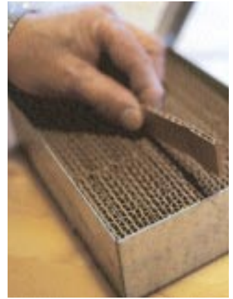
Själva värmeväxlaren med lamellpaket av wellpapp.

utväxlad friskluft, vilket kan ligga bakom en del problem med allergier, säger Peter Björs. Även ur den aspekten kan detta vara en bra lösning.